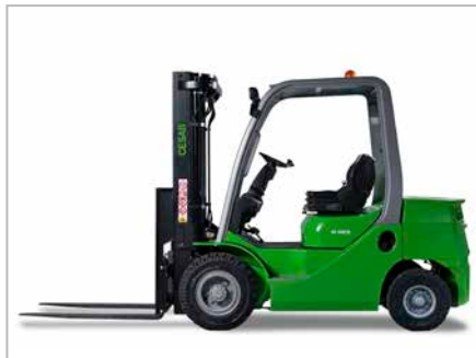
CESAB M320 - M325