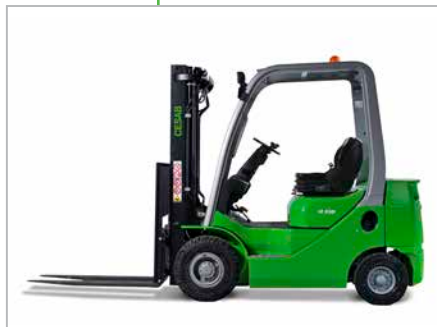
CESAB M315 - M318