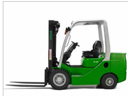
CESAB M330 - M335